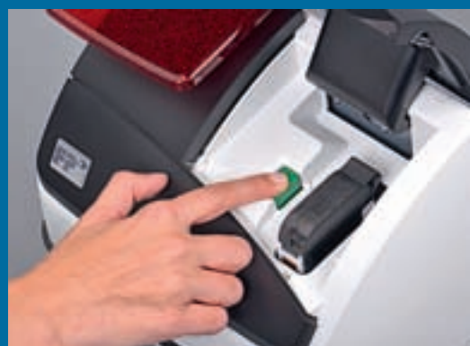
HILFSBEREIT: Über das Display (Foto oben) werden alle notwendigen Schritte, wie beispielsweise beim Kassettenwechsel, erklärt.

In der Tat, auch im FACTS-Test machte die PostBase Mini eine gute Figur. Als Erstes überzeugte sie in Sachen Bedienung und Handhabung, denn der neue junge FACTS-Mitarbeiter, der nie eine Frankiermaschine bedient hatte, kam in kürzester Zeit mit dem Frankiersystem klar.