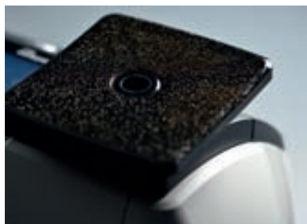
HIGHLIGHTS: Der Wiegeteller (Foto links) ist in verschiedenen Farben erhältlich. Die PostBase Mini ist mit Anschlüssen für den PC und für das Netzwerk ausgestattet (Foto rechts).

Der Grund dafür ist das 3,5 Zoll große Farb-Touchdisplay, über das sowohl die Ersteinrichtung, die im Test nur wenige Minuten dauerte, als auch das Frankieren intuitiv möglich sind.